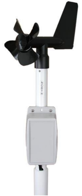
( 風向・風速計 )